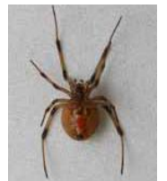
セアカゴケグモ ハイロゴケグモ